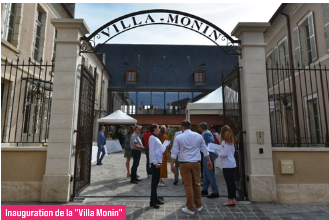
Inauguration de la "Villa Monin"