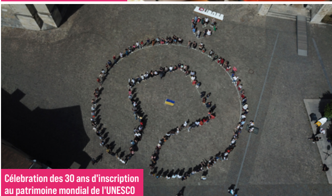
Célébration des 30 ans d'inscription au patrimoine mondial de l'UNESCO