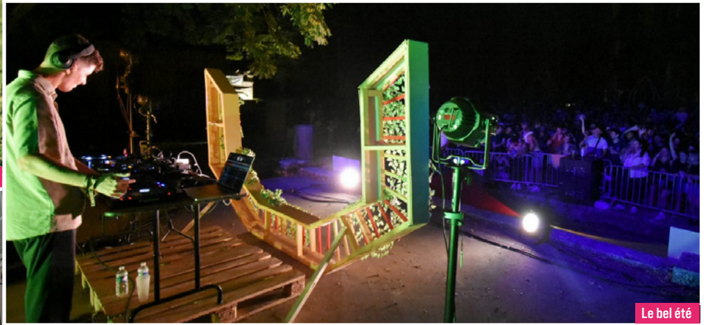
Le bel été