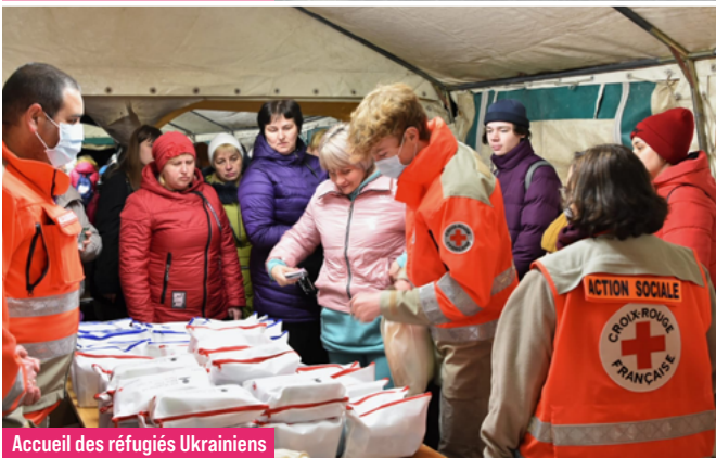
Accueil des réfugiés Ukrainiens