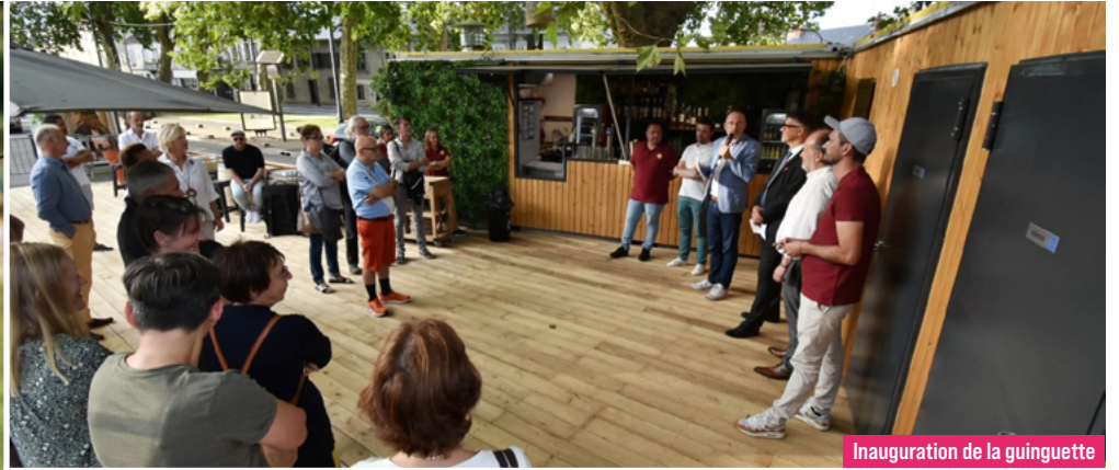
Inauguration de la guinguette