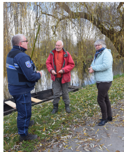
Un travail de terrain avec les maraîchers

« L'été dernier, avec un collègue de la police municipale, nous avons dû sortir, la barque pour installer des boudins flottants pour stopper une pollution à la suite d'un versement sauvage de pots de peinture dans la Voiselle ». Une incivilité qui s'ajoute aux 500 interventions enregistrées depuis sa prise de fonction. Sa satisfaction ? « Lorsque vous réglez un problème d'incivilité, vous apportez une solution et c'est plaisant. Je suis heureux lorsque les riverains retrouvent le plaisir de vivre dans leur quartier ».