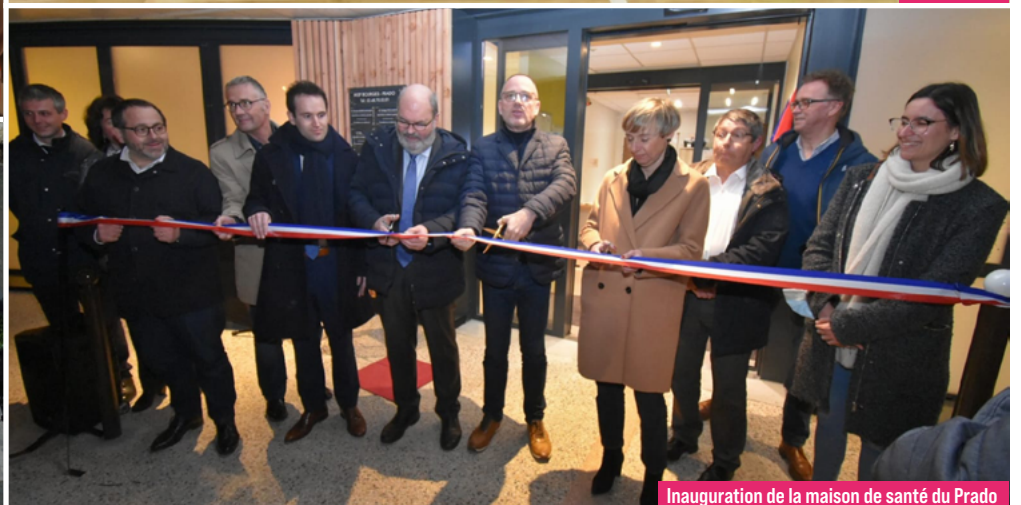
Inauguration de la maison de santé du Prado