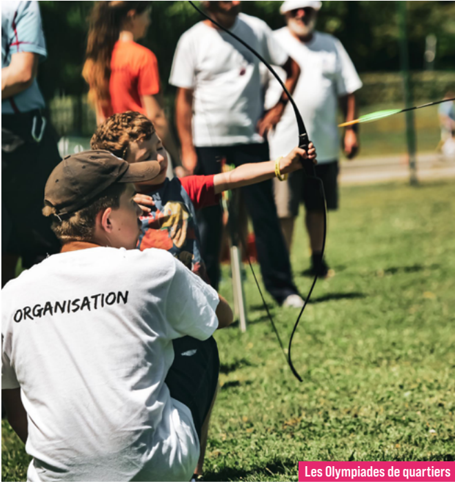
Les Olympiades de quartiers