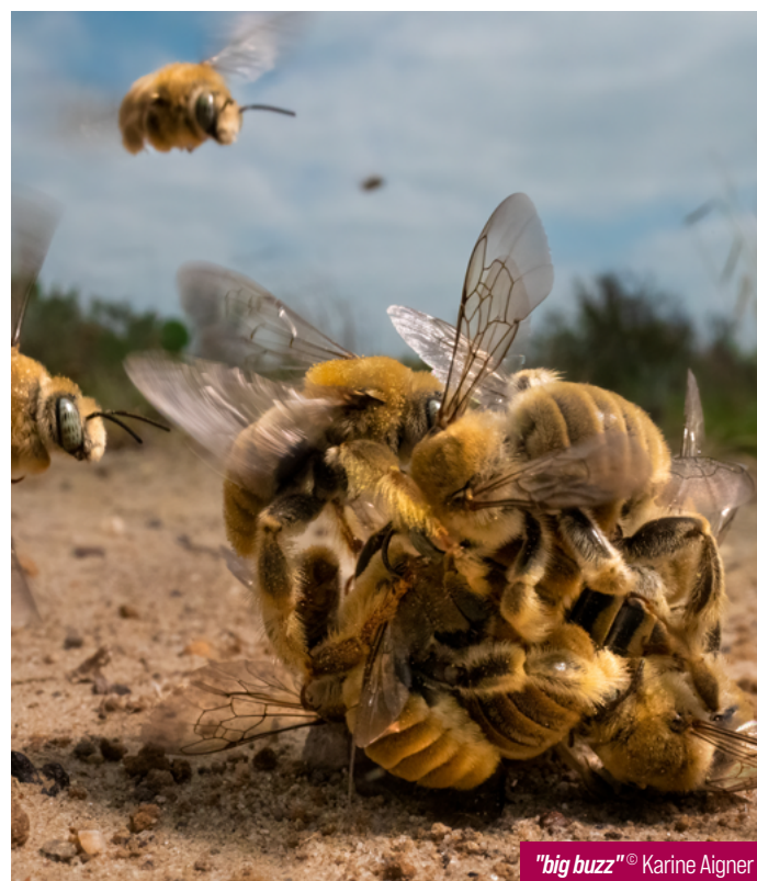
"big buzz"