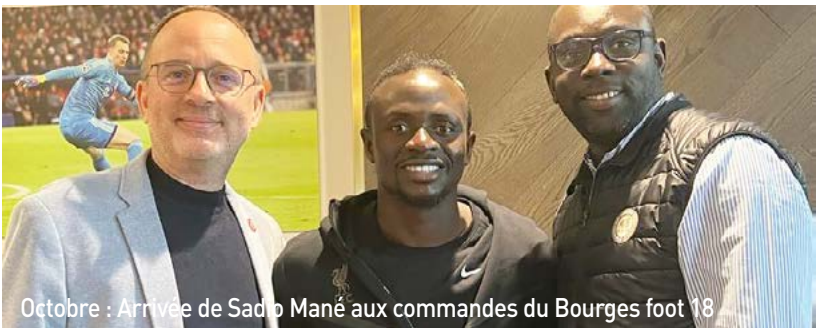
Octobre : Arrivée de Sadio Mané aux commandes du Bourges foot 18