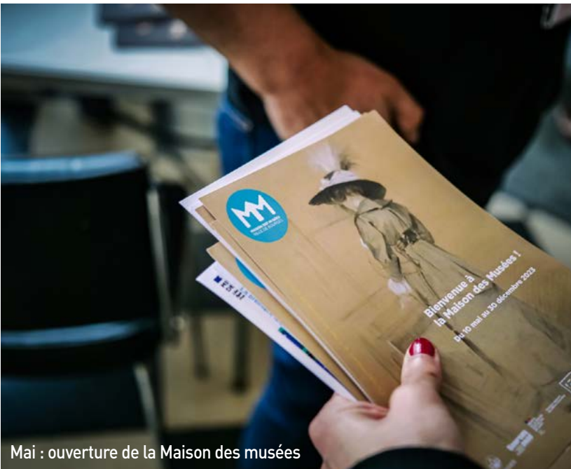
Mai : ouverture de la Maison des musées