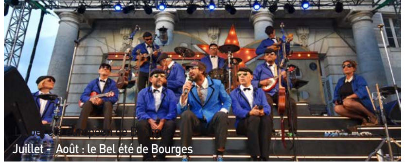
Juillet - Août : le Bel été de Bourges