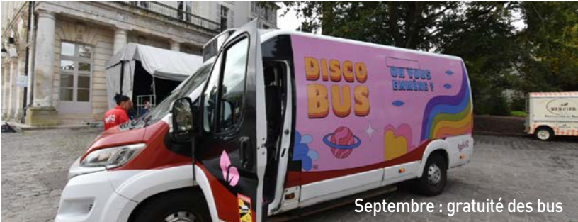
Septembre : gratuité des bus