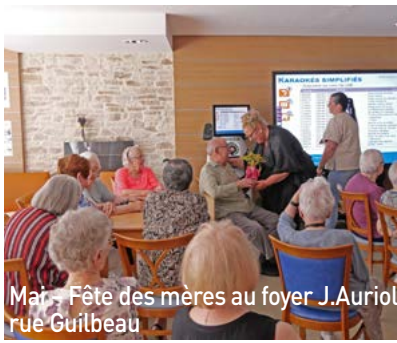
Mai : Fête des mères au foyer J.Auriol rue Guilbeau