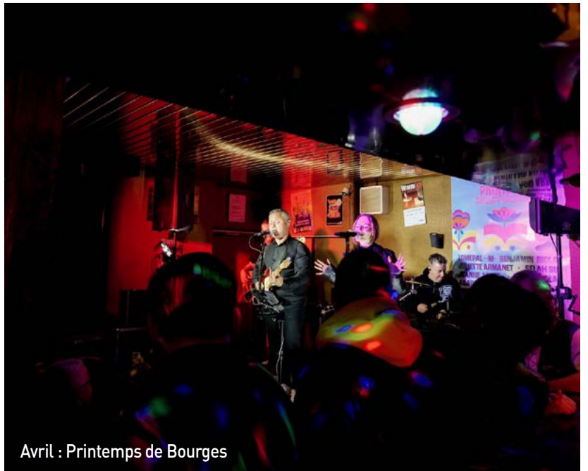
Avril : Printemps de Bourges