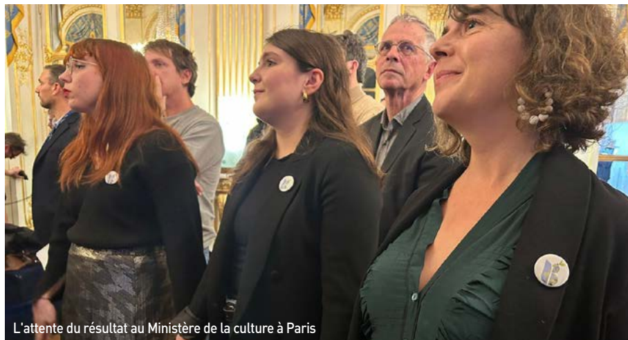
L'attente du résultat au Ministère de la culture à Paris