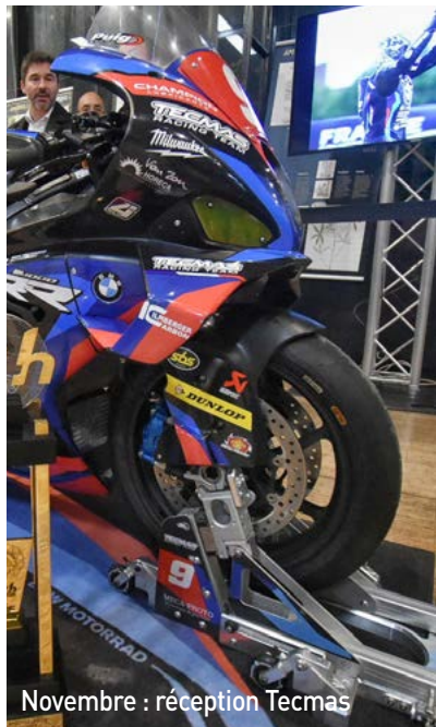
Novembre : réception Tecmas