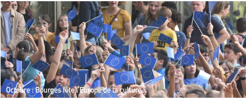
Octobre : Bourges fête l'Europe de la culture