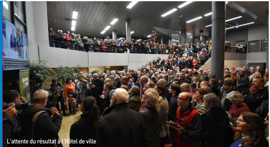
L'attente du résultat à l'Hôtel de ville