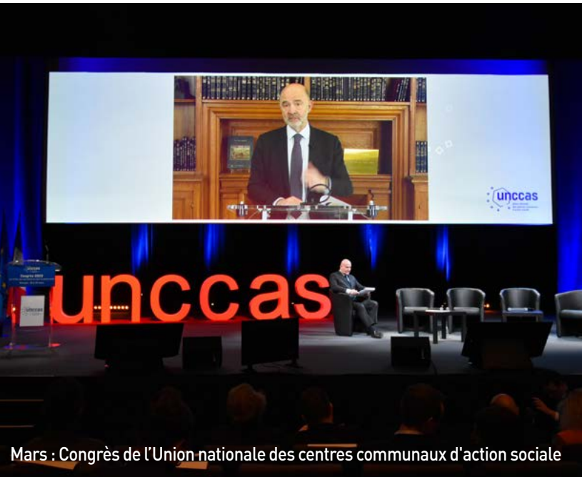
Mars : Congrès de l'Union nationale des centres communaux d'action sociale