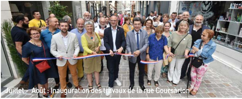
Juillet - Août : Inauguration des travaux de la rue Coursarlon