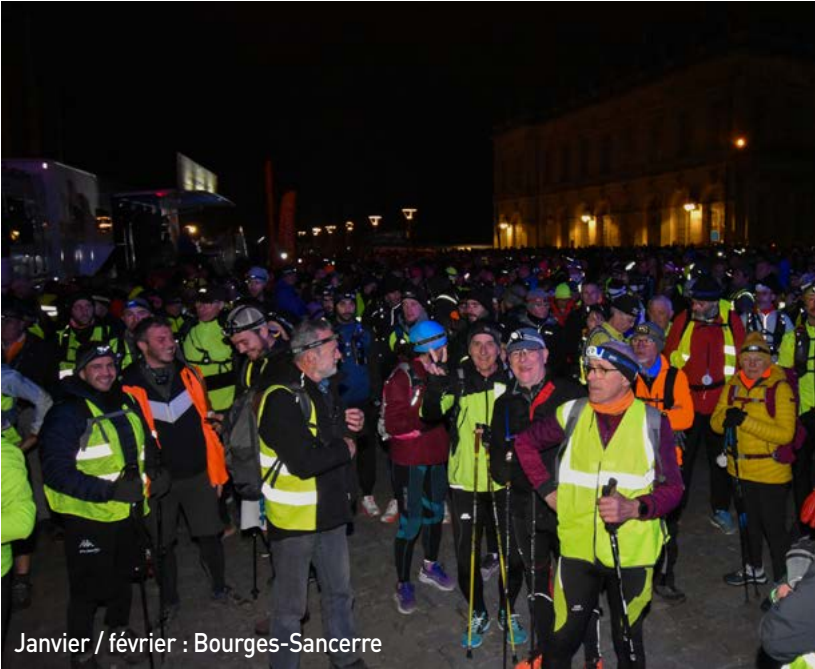
Janvier / février : Bourges-Sancerre