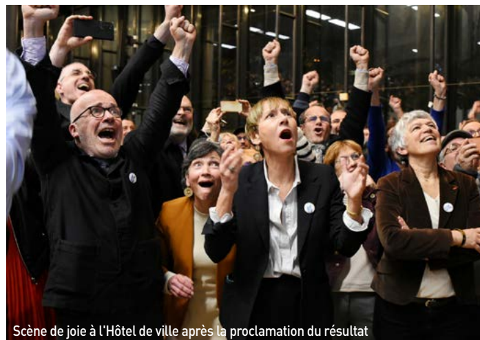
Scène de joie à l'Hôtel de ville après la proclamation du résultat