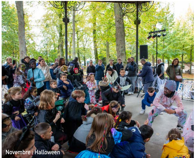
Novembre : Halloween