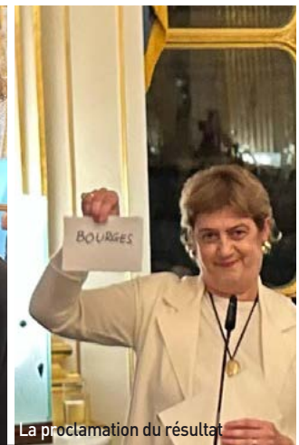
La proclamation du résultat