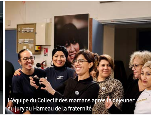
L'équipe du Collectif des mamans après le déjeuner du jury au Hameau de la fraternité