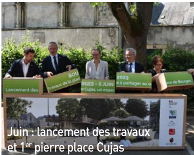
Juin : lancement des travaux et 1 er pierre place Cujas