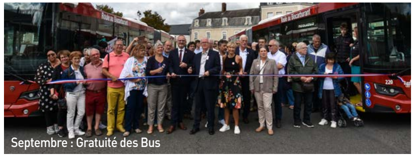
Septembre : Gratuité des Bus