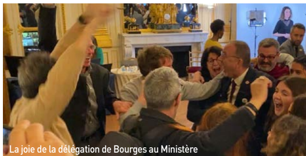
La joie de la délégation de Bourges au Ministère