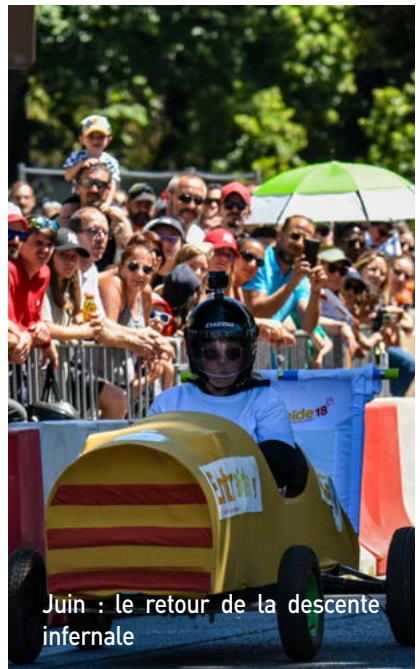
Juin : le retour de la descente infernale