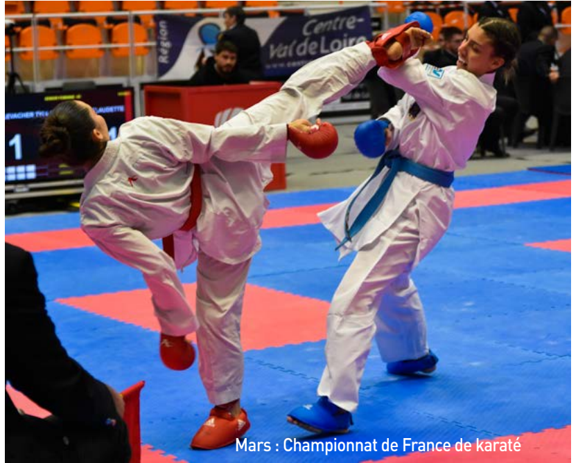
Mars : Championnat de France de karaté